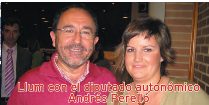
Llum con el diputado autonómico Andrés Perelló

El PSOE se compromete a que el dinero público y la gestión de los servicios municipales sean instrumentos de mejora de la calidad de vida de los ciudadanos de Siete Aguas. Con tal finalidad, hemos creado un Proyecto de Desarrollo Local, sujeto a la búsqueda del interés general, por encima de los intereses particulares. Los principales aspectos que lo definen son los siguientes.