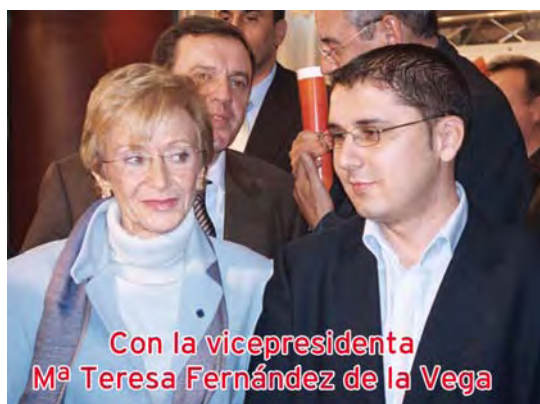
Con la vicepresidenta M a Teresa Fernández de la Vega

Además, proponemos la creación de un Grupo de Voluntariado para la colaboración en los distintos eventos que se celebren en Siete Aguas (Cabalgata de Reyes, Gran Fondo, Semana Cultural, etc.), de manera que se fomente la participación e integración en la vida social y cultural de nuestra población.